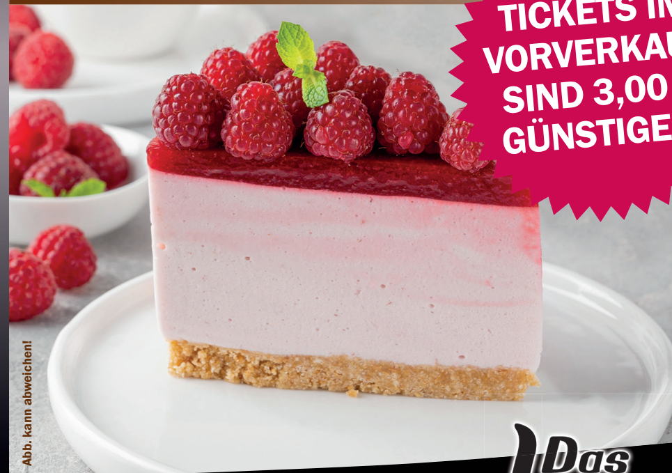
Abb. kann abweichen!

HOTLINE FÜR SERVICE- & TICKETVERKAUF: 040 55 55 5 88 614