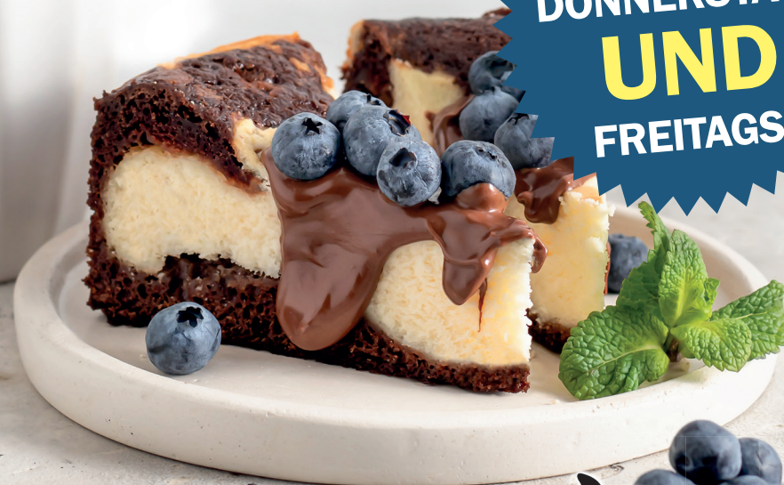
Abb. kann abweichen!