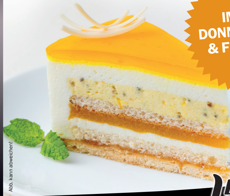
Abb. kann abweichen!