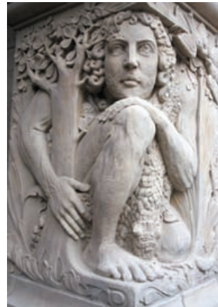
Die Stadtgeschichte Duisburgs aus DDR-Sicht

Achtung: Wegen Corona in diesem Semester keine Abendkasse! Vorherige verbindliche Anmeldung notwendig; auch mit VHS-Karte!