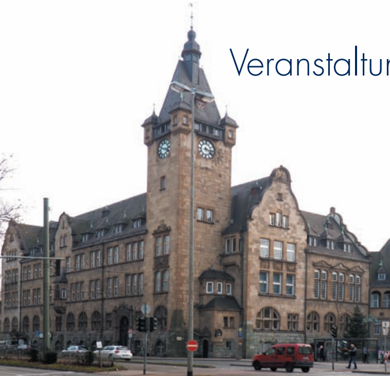
Von der Landbürgermeisterei Hamborn zum größten Dorf Preußens