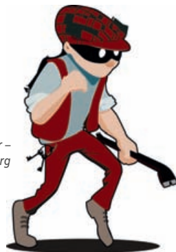
Riegel vor – Sicherer in Duisburg

VHS der Stadt Duisburg Steinsche Gasse 26 47049 Duisburg Tel. 0203-283 2616