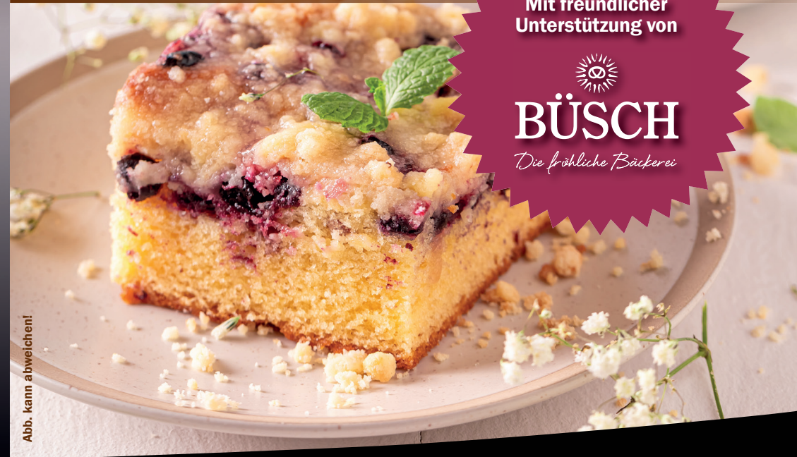
Abb. kann abweichen!