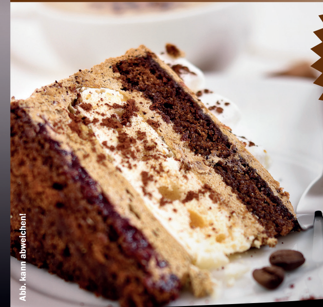
Abb. kann abweichen!

NUTZEN SIE GERNE UNSEREN FAHRSTUHL VOM PARKPLATZ AUS KOMMEND – BITTE KLINGELN, IHNEN WIRD GEÖFFNET!